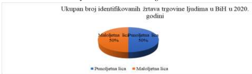
Grafikon 10. Podaci o ukupnom broju identifikovanih žrtava trgovine ljudima u BiH u 2020. godini.