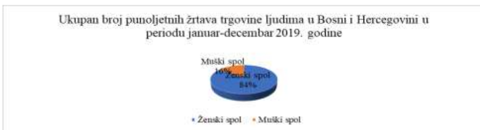
Grafikon 7. Podaci o ukupnom broju punoljetnih žrtava trgovine ljudima u Bosni i Hercegovini u periodu januar-decembar 2019. godine