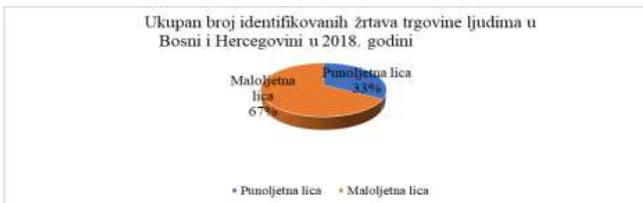
Grafikon 2. Podaci o ukupnom broju identifikovanih žrtava trgovine ljudima u Bosni i Hercegovini u 2018. godini