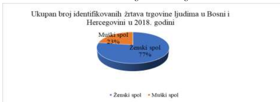
Grafikon 1. Podaci o ukupnom broju identifikovanih žrtava trgovine ljudima u Bosni i Hercegovini 2018. godine