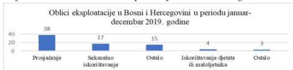
Grafikon 9. Podaci o oblicima eksploatacije u Bosni i Hercegovini za 2019.