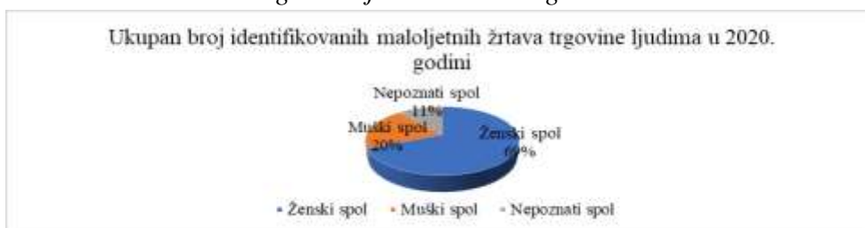
Grafikon 11. Podaci o ukupnom broju identifikovanih maloljetnih žrtava trgovine ljudima u 2020. godini.