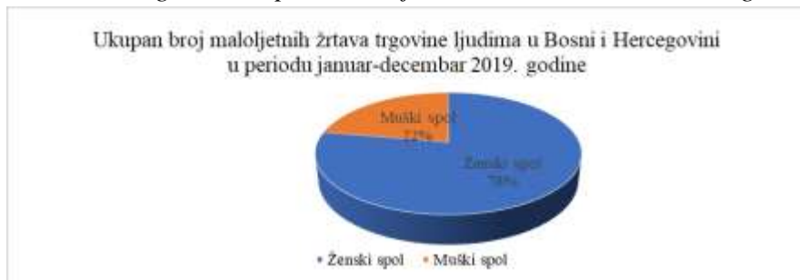
Grafikon 8. Podaci o ukupnom broju maloljetnih žrtava trgovine ljudima u Bosni i Hercegovini za period od januara do decembra 2019. godine