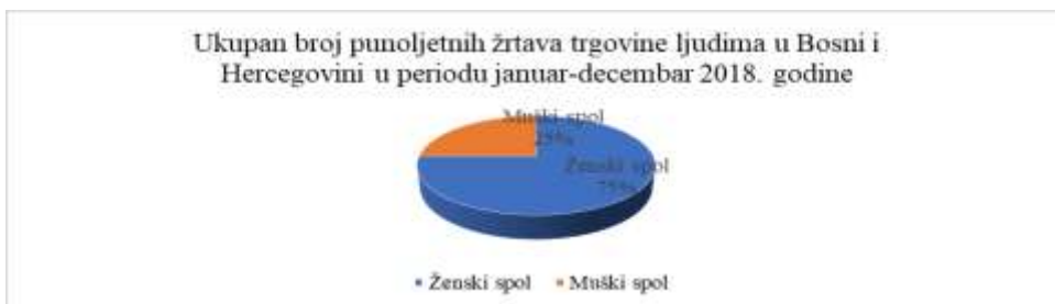
Grafikon 3. Podaci o ukupnom broju punoljetnih žrtava trgovine ljudima u Bosni i Hercegovini u periodu januar-decembar 2018. godine