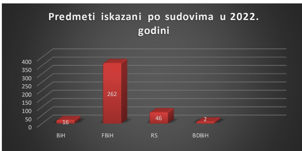
Grafikon br. 1 Izvještaj iz Središnje baze podataka o počinjenim teškim kaznenim djelima u BiH u 2022. godini. Ministarstvo pravde BiH

Ukupan broj završenih, odnosno pravomoćnih predmeta pred svim sudovima u Bosni i Hercegovini, a koji su dostavljeni Ministarstvu pravde BiH u 2022. godini za navedena kaznena djela iznosi 326. Pred Sudom BiH za tri godine izvještajnog razdoblja procesuirano je 69 predmeta. Pred sudovima na području Federacije BiH u ovom izvještajnom razdoblju od tri godine ukupno je procesuirano 877 predmeta, odnosno oko 72% predmeta od ukupnog broja evidentiranih predmeta za navedene godine. Ovako veliki broj pravomoćnih presuda na području Federacije BiH objašnjava se činjenicom da KZ FBiH samo posjedovanje opojnih droga inkriminira kao krivično djelo, što nije slučaj u Krivičnom zakoniku Republike Srpske i Krivičnom zakonu Brčko distrikta BiH. Pred sudovima na području Republike Srpske za izvještajno razdoblje od tri godine bilo je 256 predmeta, dok je na teritoriji Brčko distrikta Bosne i Hercegovine prema dostupnim podacima zabilježen broj od 20 predmeta.