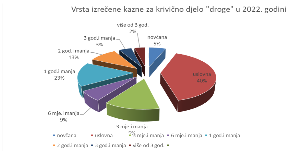
Grafikon br. 2 Izyještaj iz Središnje baze podataka o počinjenim teškim kaznenim djelima u BiH u 2022. godini. Ministarstvo pravde BiH

odnose na maloljetnike, a iste nisu unesene u navedenu bazu budući da baza ne podržava unošenje podataka za maloljetne počinitelje. Također su dostavljene i 2 presude koje se odnose na gore navedena krivična djela a počiniteljima su izrečene sudske opomene kao mjere sigurnosti, koje također kroz bazu podataka nije bilo moguće unijeti. U 2022. godini kao najbrojnije kazne izricane za krivična djela zloupotrebe droga su uvjetne osude, a što čini oko 40% od ukupno izrečenih osuda.