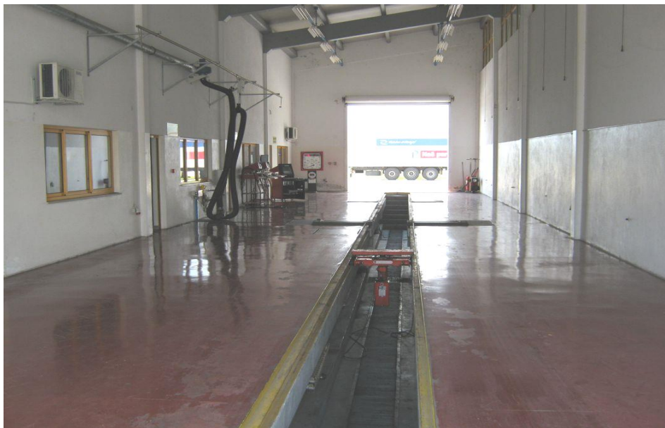
Slika 2. Izgled stanice za tehnički pregled vozila tvrtke „Centar motor“

Danas je stanica za redoviti tehnički pregled vozila poduzeća „Centar motor“ moderno uređena i opremljena a sa gabaritima je takva da može primiti bilo koje uobičajeno cestovno vozilo (od osobnog automobila do najvećeg teretnog vozila sa prikolicom).