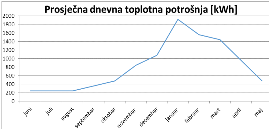
Slika 1. Prosječne dnevne vrijednosti ukupne toplotne potrošnje stambenog objekta u toku jedne godine

Sa dijagrama se vidi da je toplotna potrošnja poprilično ujednačena u ljetnim mjesecima (krajnja lijeva strana dijagrama). Činjenica je da se toplota u tim mjesecima koristi samo za potrebe tople vode. U zimskim mjesecima potreba za toplotom znatno raste, jer potreba toplote za grijanjem višestruko nadmašuje potrebu za zagrijavanje vode. U tim mjesecima je toplotno opterećenje i najveće, te bi tako kogeneracijski sistem u većini zimskih sati trebao raditi punim intenzitetom. Najviša dnevna toplotna potrošnja u ovom primjeru je 1920 kWh i pojavljuje se u januaru koji je zapravo i najhladniji mjesec u posljednjih 10 godina u Sarajevu. Međutim, nije dovoljno samo na osnovu toplotnih gubitaka i krive toplotnog opterećenja odrediti nazivnu snagu mikrokogeneracijskog sistema, već je potrebno formirati i LDC krivu (krivu trajanja opterećenja). LDC kriva za odabrani stambeni objekat u gradu Sarajevu je prikazana na sljedećoj slici 2: